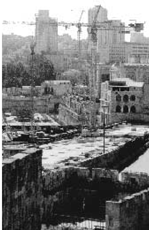
Eyal Hotel er en av skyskraperne i bakgrunnen.

Bet Norvegia. Hatzfira str. 26, Emek Rephaim. Jerusalem. Tel: 02-5638923.