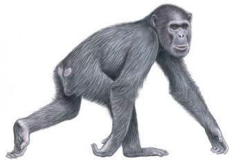
Chimpanzé d'Afrique centrale ( Pan troglodytes troglodytes )

La Section des grands singes du Groupe de spécialistes des primates de la CSE/UICN est une équipe d'experts à la tête de la recherche et de la conservation des grands singes. Le rôle de la SGS est de promouvoir une action de conservation en faveur des grands singes sur la base des meilleures informations scientifiques disponibles. La SGS sert également de forum de discussion et d'échange d'informations; ses membres produisent des lignes directrices en matière de meilleures pratiques dans le domaine de la recherche et de la conservation, conçoivent des plans d'action et apportent des conseils pour une protection efficace des populations sauvages de grands singes.