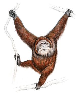
l’orang-outan de Sumatra ( Pongo abelii )

La base de données sur les populations, l’environnement et les inventaires de grands singes (Ape Populations, Environments and Surveys—A.P.E.S.) est une initiative conjointe de l’institut Max Planck d’anthropologie évolutionniste et la SGS. A.P.E.S. est un dépositaire de données d’inventaire sur les grands singes, un référentiel d’informations pour le suivi des populations et de distributions permettant d’analyser l’évolution des populations et de définir les priorités, de tester les hypothèses et de recommander des orientations politiques. La base de données est l’élément central du Portail A.P.E.S., où des données sur le statut des espèces, la distribution géographique, la probabilité et les tendances de présence, et les menaces sont disponibles et seront régulièrement mises à jour. Voir: http://apesportal.eva.mpg.de/