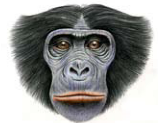
Bonobo ( Pan paniscus )