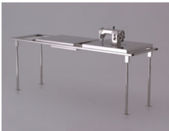
Links: een vernikkelde naaimachinetafel (eindexamenproject 2001).