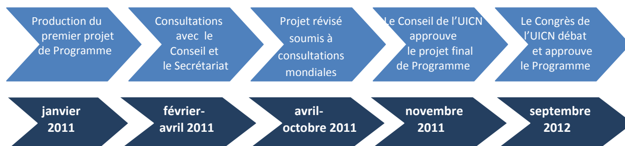
Figure 1: Programme de l'UICN 2013-2016, Calendrier de développement

Pendant les prochains six mois, les consultations sur le projet de Programme seront possibles via le Portail des Membres de l'UICN, les Forums régionaux de la nature en 2011, ainsi qu'au travers des réseaux de l'UICN. Ces consultations aboutiront à un projet final de Programme 2013-2016 qui sera examiné lors du Congrès mondial de la nature en 2012, pendant lequel les Membres de l'UICN pourront débattre et finalement approuver le document.