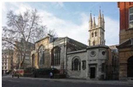
Церковь Гроба Господня в Холборне

Эта древняя величественная церковь стоит в старинном районе Холборн в черте Лондонского Сити, на улице Холборн-Виадук, напротив здания Центрального уголовного суда. В давние времена она находилась прямо за пределами старой городской стены близ ворот Ньюгейт.