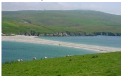
Остров св. Ниниана

Позднее слава о святом так возросла, что его почитали и в далеких от Шотландии краях, например, в Кенте и даже Дании. Сегодня святой почитается и на другом континенте: в США и в канадской провинции Новая Шотландия, где католический собор в городе Антигонииш освящен в его честь.