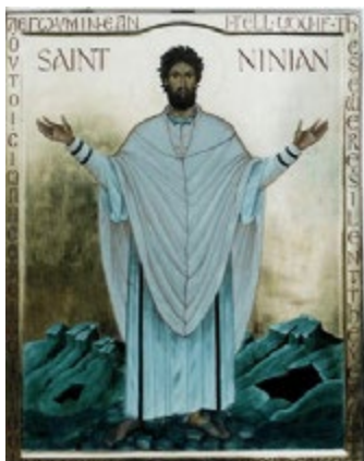
св. Ниниан Уитхорнский

христианства. Вероятно, его родиной была Камбрия на северо-западе нынешней Англии; по крайней мере известно, что светильник шотландской Церкви родился к югу от Адрианова вала. Отец Ниниана был местным правителем и исповедовал христианство. Еще в юном возрасте Ниниан ощутил призвание просвещать родную страну светом Христовым. Молодой человек поехал обучаться в Рим, а спустя некоторое время – посетил Галлию, где в монастыре города Тур он познакомился со святым Мартином – великим миссионером и отцом-основателем монашества в Галлии. Ниниан был посвящен во епископа либо в