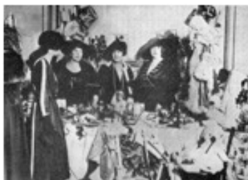
Предрождественский «базар» в Лондонском храме, 1920-е годы

Сторонники митр. Евлогия заявили о создании отдельного, подчинявшегося ему, прихода (патриаршего или «евлогианского»), и предложили архиеп. Серафиму и прихожанам, верным Синоду в Карловцах, поделить Успенский храм между двумя приходами. Служили попеременно: одну субботу и воскресенье – евлогианский приход, следующие – зарубежный; праздники также делились. Оба прихода со временем обзавелись приходским домом