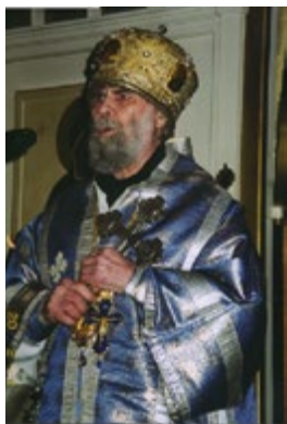
Митрополит Антоний Сурожский

В Своем Евангелии Господь и Бог наш говорит: Когда наступает время младенцу родиться, то бывает скорбь: когда же родится — пребывает одна радость, ибо новая жизнь вошла в мир... И когда рождается ребенок, окружающие дивятся: какова будет судьба этого младенца? Рождение младенца — только первый день его; какова будет долгая череда дней, составляющих человеческую жизнь? И каков будет последний день, который подведет итог всему, что было жизнью этого человека?