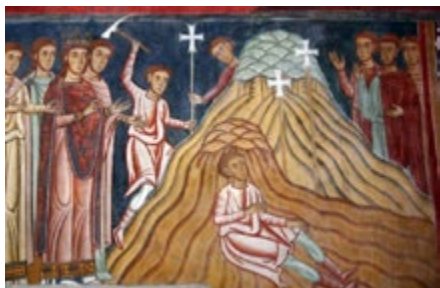
Императрица Елена находит животворящий крест. Капелла Сан-Сильвестро (XIII век) в монастырском комплексе Санти-Куаттро-Коронати

более сорока или пятидесяти, и с ними приходит много их клириков. И что говорить много? Тот, кто не будет участвовать в столь великом торжестве в эти дни, полагает, что он впал в величайший грех, если только не будет какой-нибудь препятствующей необходимости, которая удерживает человека от благого намерения. В эти дни обновлений украшение всех церквей бывает то же, какое бывает в Пасху и в Богоявление, и каждый день правится служба в различных святых местах так же, как в Пасху и в Богоявление. Ибо в первый и второй день правится служба в большой церкви, которая зовется Мартириум. На третий день — на Елеоне, т. е. в церкви, что на горе, откуда вознесся Господь на небо после страданий, в какой-либо церкви есть пещера, в которой учил Господь апостолов на горе Масличной. В четвертый же день... [лакуна]»[3]. Также, по свидетельству церковного историка Созомена (V в.), со времени освящения Мартириума при Константине Великом «Иерусалимская Церковь совершает этот праздник ежегодно и весьма торжественно, так что тогда преподается даже таинство крещения и церковные собрания продолжаются 8 дней; по случаю этого торжества туда стекаются, для посещения св. мест, многие почти со всей подсолнечной»[4].