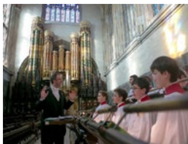
Хоровое занятие в Итонской часовне

трети от общего числа учащихся) называет себя христианами, но большинство из них связывают себя с христианством лишь в «культурном смысле» (празднуют Рождество и Пасху) или даже в чисто практическом смысле (собираются венчаться в церкви Англии).