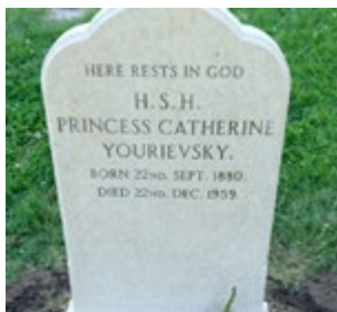
Мои́ла Княжны Е. Юрьевской до и после реставрации