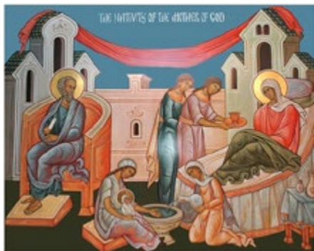
Икона Рождества Пресвятой Богородицы

Пресвятая Дева Мария родилась в то время, когда люди дошли до таких пределов нравственного упадка, при которых их восстание казалось уже невозможным. Лучшие умы той эпохи сознавали и часто открыто говорили, что Бог должен сойти в мир, чтобы исправить веру и не допустить