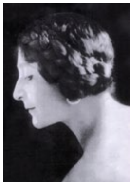
Княжна Екатерина Юрьевская

История того, как княжна оказалась на острове Хейлинг достойна хорошего фильма или театральной постановки, но нашей задачей было почтить ее память и, рассказывая ее историю, показать связи, существующие между Соединенным Королевством и Россией. Мы снова вернулись в церковный двор и встретили старосту англиканского прихода святого Петра, который наводил порядок на могилах и подрезал траву. Он указал нам на то, что надгробный камень ушел в землю и накренился. Церковный староста предложил нам найти местную фирму, которая бы отреставрировала надгробие и привела в порядок могилу. Мы последовали его совету и нашли деньги, чтобы покрыть расходы на реставрацию. Результат превзошел наши ожидания. Надгробие смотрелось так, как будто его