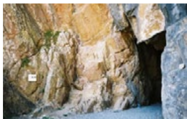
Пещера св. Ниниана

Уитхорн называется так потому, что стены монастырской церкви были возведены из камня, покрытого известковой штукатуркой белого цвета, что было необычным для Британии того времени. Само название «Уитхорн» переводится как «побеленная церковь» или «белый дом», а на протяжении средневековья эта великолепная церковь, как и вся огромная епархия Уитхорна, называлась «Кандида Каза», то есть «белый дом» в переводе с латыни. Церковь была построена в римском стиле и по лучшим стандартам того времени.