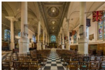
Интерьер церкви Гроба Господня в Холборне.

Среди знаменитостей, захороненных в храме, упомянем Роджера Эшема (1515-1568: ученый, писатель, педагог, учитель Елизаветы I) и Томаса Калпепера (любимый придворный Генриха VIII, который завел роман с пятой женой короля – Екатериной Говард – и был