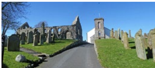
Руины приората на полуострове Уитхорн

Уитхорн с древнейших времен имел тесные отношения со странами Средиземноморья. Его насельники славились ученостью и строгостью жизни по образцу, перенятому с христианского Востока. На Уитхорне, получившем славу миссионерского