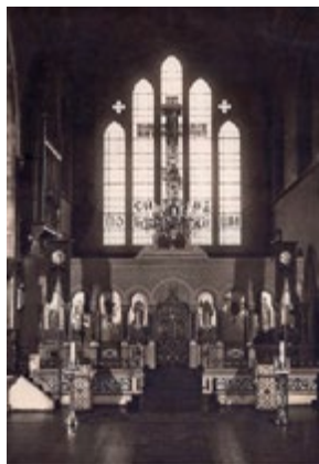
Внутреннее убранство лондонской Русской Успенской церкви (церкви апостола Филиппа)

С концом Российской Империи начинается новый этап в жизни Русской церкви в Лондоне. Поддержки Российского государства ждать не приходилось; к тому же количество верных, молящихся в Посольской церкви, выросло в несколько раз за счет беженцев, и на праздники часовня на Уэльбек-стрит никак не могла вместить всех молящихся. В октябре 1919 г. решением общего собрания был учрежден Лондонский Успенский приход Русской Православной Церкви, а в качестве приходского устава был взят устав, утвержденный Поместным Собором 1917-18 гг. Было создано сестричество во имя прп. Ксении; первой старшей сестрой стала великая княгиня Ксения, сестра императора-страстотерпца Николая.