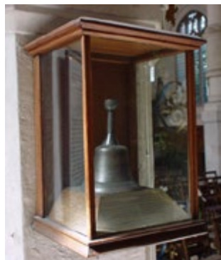
Один из колоколов храма.

Храм Гроба Господня является главной церковью музыкантов Британии. С ним связаны имена знаменитых композиторов. Северный боковой неф содержит «часовню музыкантов», где на витражах увековечены великий