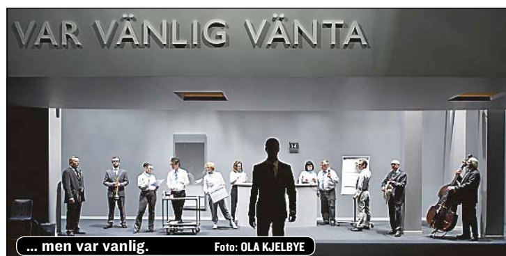
... men vanlig.

Kafkas inferno blir till en jobbig mammaliknande advokat,