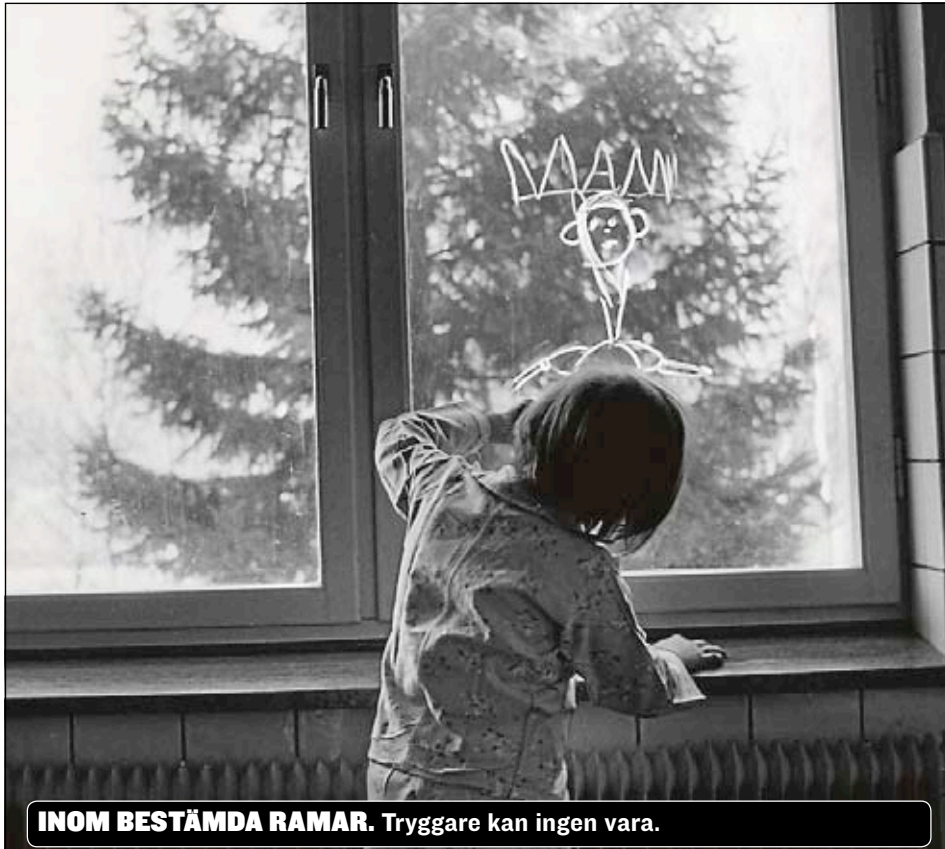
INOM BESTÄMDA RAMAR. Tryggare kan ingen vara.

Och självklart behövs det struktur. Jag minns den enorma glädjen när jag själv upptäckte Måns och Mari -serien och läste den för mina småbarn kväll efter kväll. På våren läste vi Måns och Mari om våren , På sommaren Måns och Mari om sommaren och så vidare – vi rabblade fågelarter och lärde oss svampar, byggde