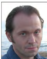
Gissur Ó Erlingsson Centrum för kommunstrategiska studier, Linköpings universitet