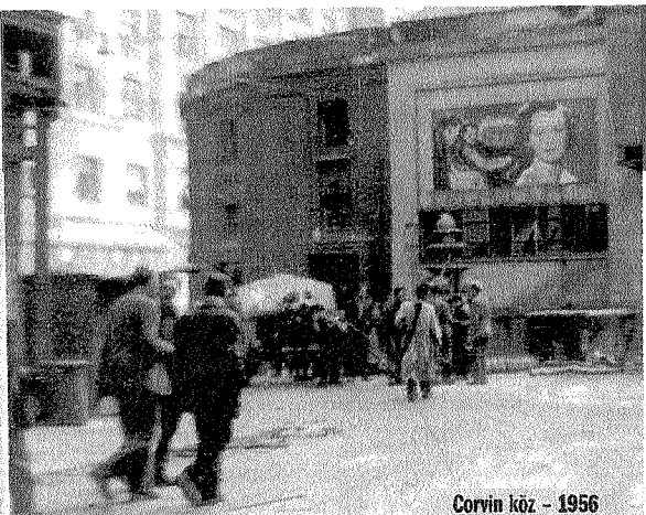
Corvin köz - 1956