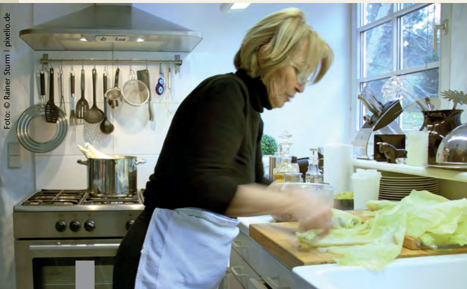
Neue Haushaltsgeräte in der Küche sorgen nicht nur für mehr Vergnügen beim Kochen, sondern bewirken gleichzeitig eine bessere Energieeffizienz.

Neue Haushaltsgeräte bieten verlockend viele neue Funktionen und sparen dabei auch noch Stromkosten. Wichtig ist aber auch, wo die neuen Geräte stehen, damit der Einspareffekt nicht sofort wieder zunichte gemacht wird. Kühlschrank und Herd sollten auf keinen Fall nebeneinander stehen. Die von Backofen und Herdplatten abgestrahlte Hitze sorgt dafür, dass der Kühlschrank zum Kühlen mehr Energie aufwenden muss. Auch neben die Heizung oder den Geschirrspüler sollte der Kühlschrank nicht gestellt werden. Die Lüftungsgitter an der Rückseite des Kühlschranks müssen frei bleiben und ein gewisser Abstand zur Küchenwand ist nötig, damit die Abwärme abfließen kann. Stehen auf dem Kühlschrank hitzerzeugende Geräte wie Mikrowelle, Kaffeemaschine oder Toaster, verbraucht der Kühlschrank ebenfalls deutlich mehr Energie – dagegen kann eine Korkunterlage helfen.