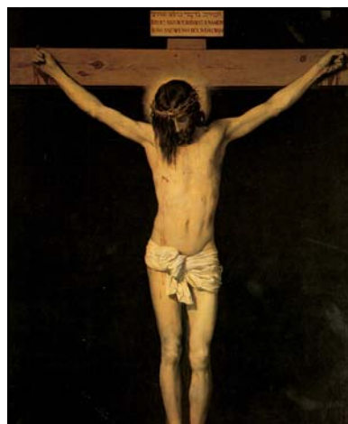
Cristo sobre la cruz por Diego Velázquez

¿Y qué significó la vara de Moisés? ¿Acaso no fue figura de la cruz? Una vez convirtió el agua en sangre; otra, devoró las serpientes ficticias de los magos; o bien dividió el mar con sus golpes y detuvo las olas, haciendo que cambiaran su curso, sumergiendo así a los enemigos mientras hacía que