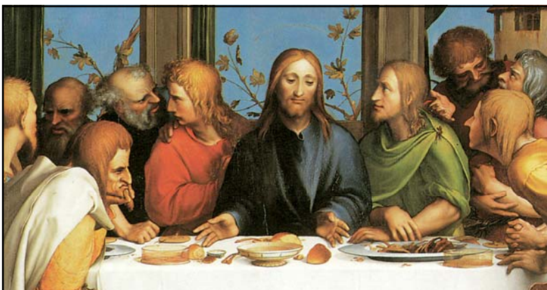
La Última Cena (detalle) por Hans Holbein el menor

Quiso, en efecto, que sus beneficios quedaran entre nosotros, quiso que las almas, redimidas por su preciosa sangre, fueran santificadas por este sacramento, imagen de su pasión; y encomendó por ello a sus fieles discípulos, a los que constituyó primeros sacerdotes de su Iglesia, que siguieran celebrando incesantemente estos misterios de vida eterna; misterios que han de celebrar todos los sacerdotes en cada una de las iglesias de todo el orbe, hasta el glorioso retorno de Cristo. De este modo los sacerdotes, junto con toda la comunidad de creyentes, contemplando todos los días el sacramento de la pasión de Cristo, llevándolo en sus ma-