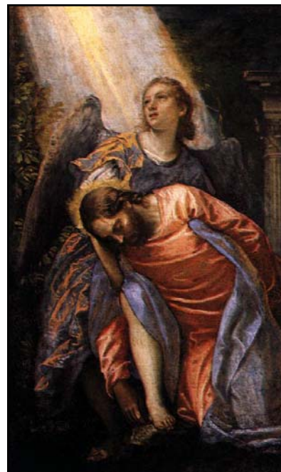
Cristo en el Jardín de Getsemaní (detalle) por Paolo Veronese

Te confío mi vida, te la doy con todo el amor de que soy capaz. Porque te amo y necesito darme a tí, ponerme en tus manos, sin limitación, sin medida, con una confianza infinita, porque tú eres mi Padre. Amén. ■